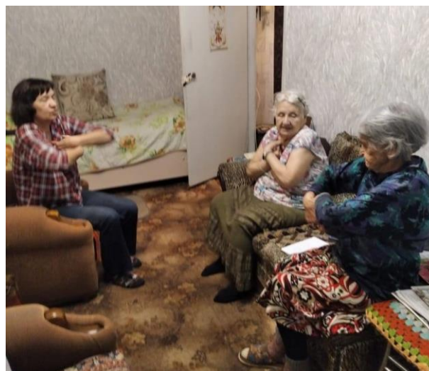
Профилактическое занятие. Гимнастика мозга