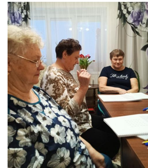
Надомные занятия в мини-группах