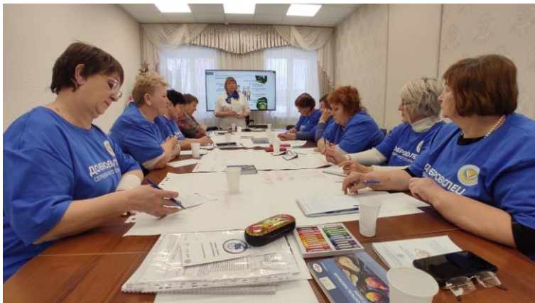
Обучение серебряных добровольцев