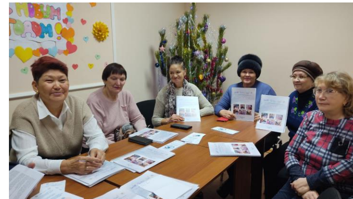
Когнитивный мастер-класс ВОИ