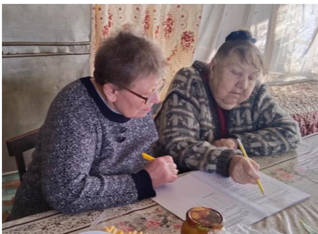
Профилактическое занятие. Когнитивный тренинг