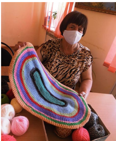
Мастерицы Рязанской области

✓ Наши НКО помогают с материалами — дома люди пекут пироги, шьют игрушки, вяжут разные изделия. Пинетки направляют в дом малютки (Саратов), пироги привозят к празднику в детские дома (Владимирская область).