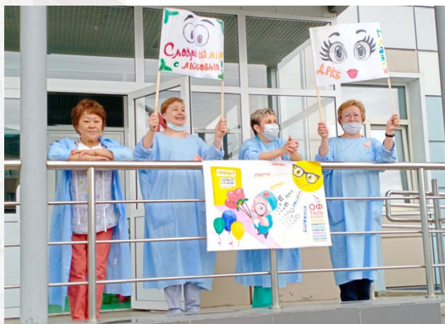
Серебряные волонтеры Бурятии выступили перед врачами республиканской инфекционной больницы