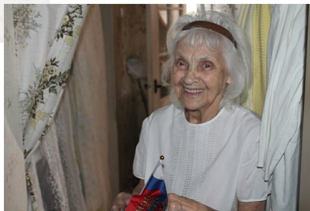
Фотогалерея Лица «Заботы», Ростовская область