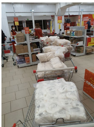
Закупка продуктов для пожилых в Саратове