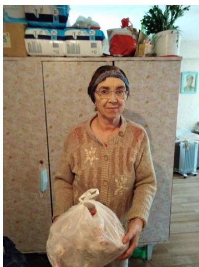
Забайкальские добровольцы развозят продуктовые наборы